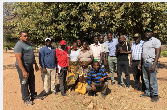
Photos de groupe